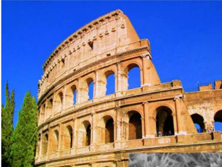
CSH-Phasen im Zement/Beton